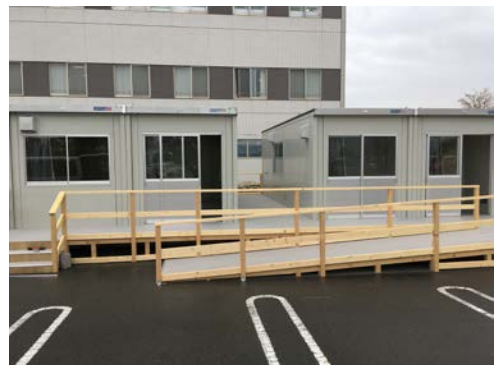
平成30年 横浜医療センターの帰国者・接触者外来