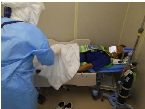
平成29年 訓練の様子