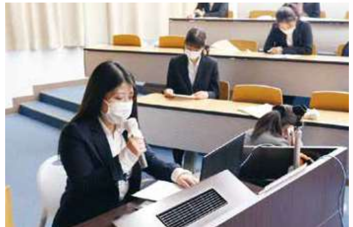
シンポジウム：発表の様子です。