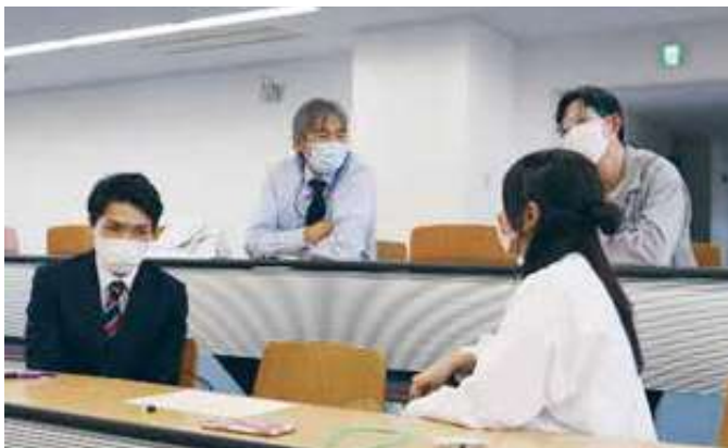
交流会（クイズ大会）：学校長も参加しました。