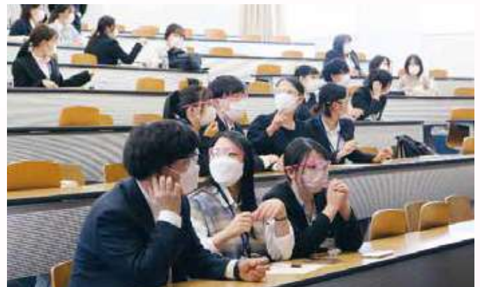
交流会（クイズ大会）：3学年混合のグループで問題に取り組んでいます。