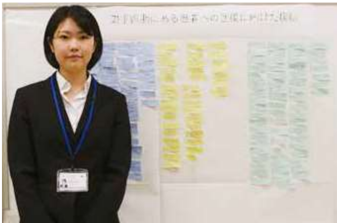
シンポジウム：発表者と学生からのコメントの付箋です。